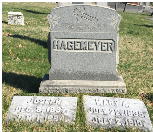
St. Mary Cemetery, Saint Bernard, Hamilton, Ohio *5