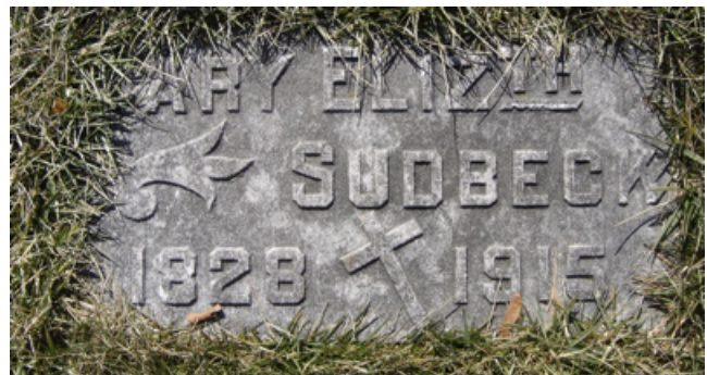
Grabsteine Saint Joseph Cemetery, Cincinnati