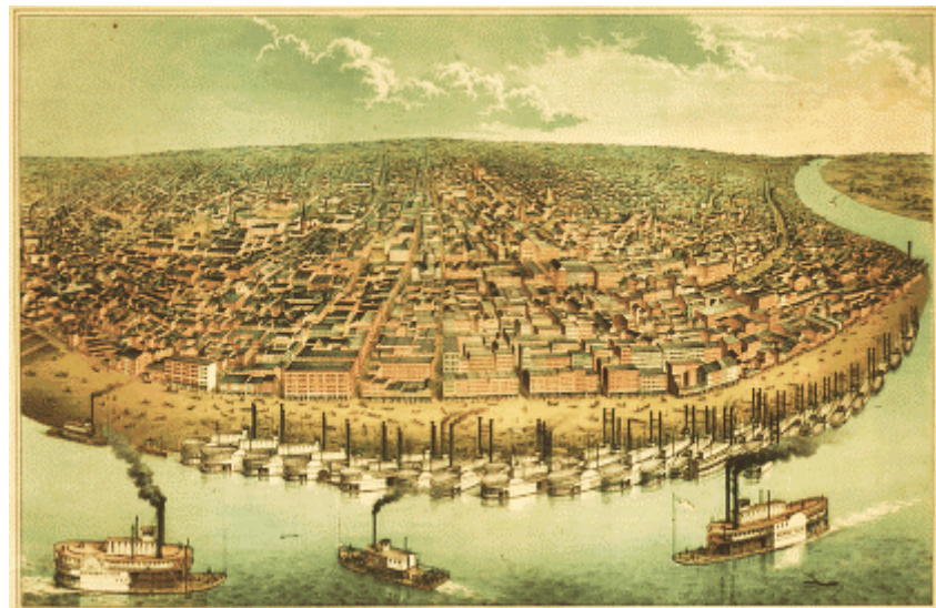
Saint Louis am Mississippi um 1853