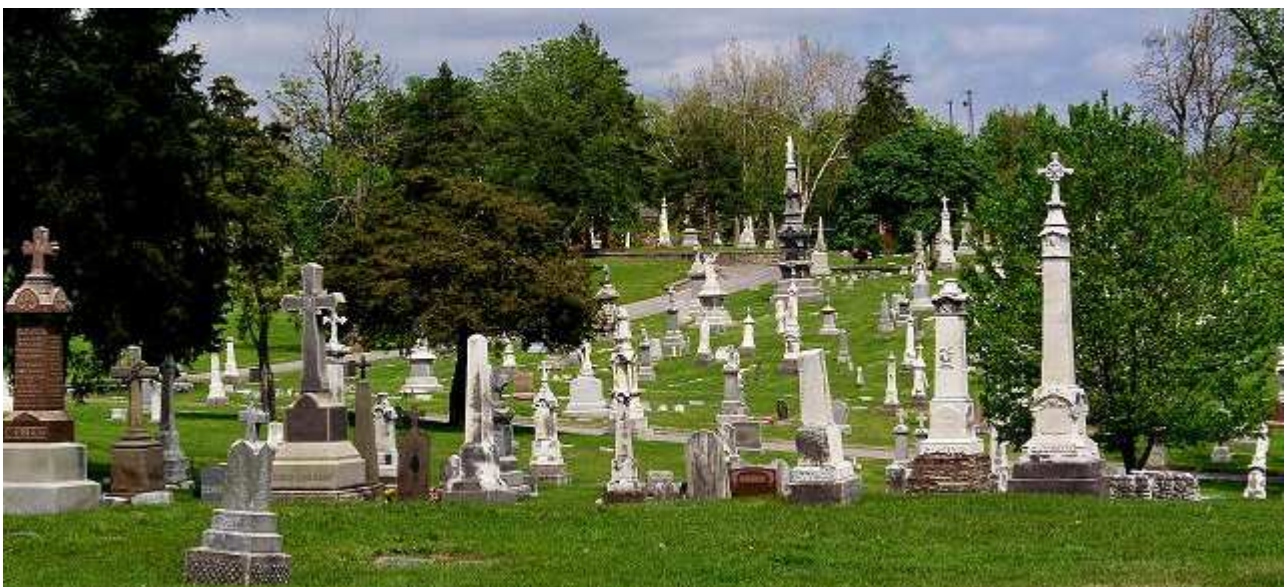
Saint Joseph's Cemetery, Cincinnati