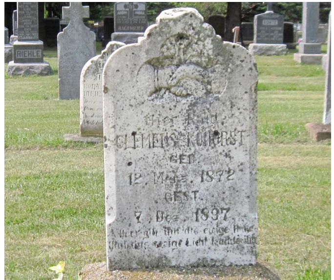
Saint Catherine's Cemetery, Farming, Stearns County, Minnesota