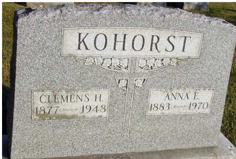
Saint Patricks Cemetery, Crittenden, Erie County, New York