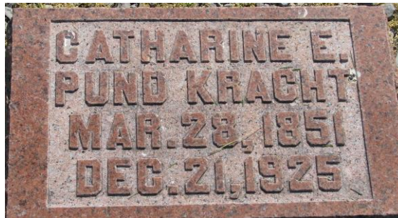
St. Peter and Paul Cemetery, Ottawa, Putnam, Ohio *1 by Kris Kreh Martin, Kenneth Croy, skydancr

Ebenfalls auf dem Schiff „Rajah“, Ankunft New Orleans am 28.10.1845: