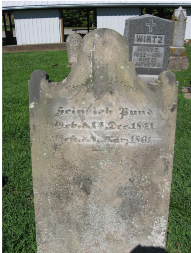
Saint Mary's of the Rock Cemetery, Franklin County, Indiana (das Sterbejahr auf dem Stein soll falsch sein)

Außerdem sind zwei Brüder von folgender Pund-Familie ausgewandert: