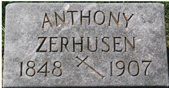
Mother of God Cemetery, Kenton Vale(Covington), Kentucky *3