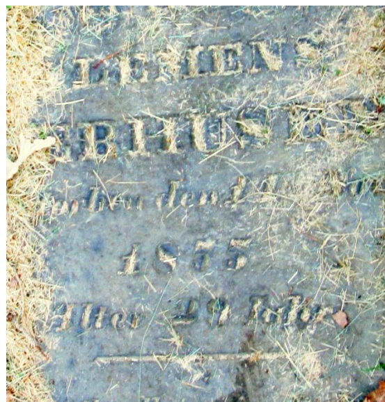
Saint Joseph Cemetery, Cincinnati, Hamilton, Ohio, Old Blocks, Block 2, Lot 15 *1 – by Carol S, Todd Withsides