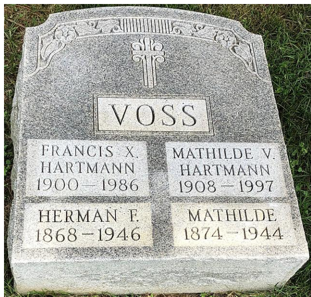
Holy Sepulchre Cemetery, Cheltenham, Montgomery County, Pennsylvania *1