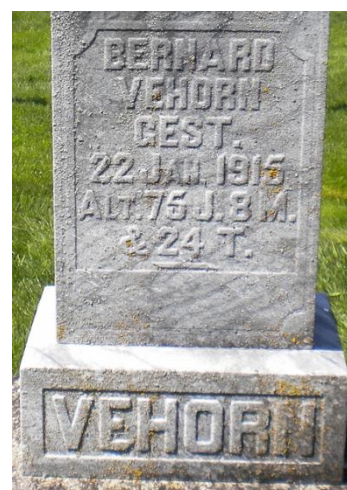
Saint John's Catholic Church Cemetery, Maria Stein, Mercer County, Ohio *1