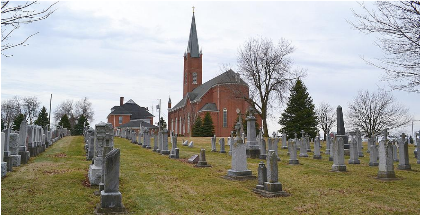
Saint John's Catholic Church Cemetery, Maria Stein, Mercer County, Ohio *1