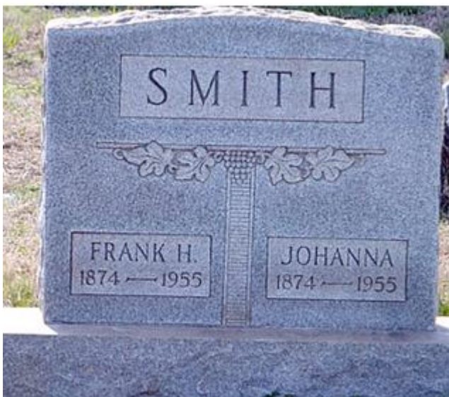
Holy Cross Cemetery, Brooklyn Park, Maryland, USA *1 - by Shelley Arnold