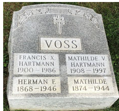
Most Holy Redeemer Cemetery, Philadelphia, Pennsylvania – by LansdaleLady *1